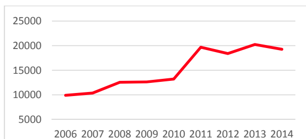
Abbildung 1: Indische Übernachtungsgäste in Hamburg

Im europäischen Vergleich liegt Hamburg mit insgesamt 12 Mio. Übernachtungen aus dem In- und Ausland im Jahr 2014 auf Platz 11 aller Städte. Im deutschen Ranking befindet sich die Hansestadt damit hinter Berlin und München auf Platz drei und verzeichnet traditionell im August jeden Jahres die meisten Übernachtungen. Insgesamt liegt der Anteil von ausländischen Touristen mit 2,9 Mio. Übernachtungen bei 24%. Dementsprechend beherbergte Hamburg im Jahr 2014 9,1 Mio. inländische Touristen. Mit 19.267 Beherbergungen im Jahr 2014 belegt Indien als Herkunftsland den 25. Rang in Hamburg und verzeichnete einen Rückgang um 5% zum Vorjahr.